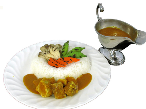
やまゆりポークと野菜のカレー I V Y 風

多くの方に愛された東京パレスホテル B2Fの「IVY HOUSE」のスパイシーなカレーを復刻