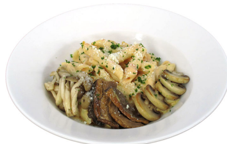
茸とクリームのペンネ

記載の料金は税込の金額です。勝手ながら、別途サービス料を加算させていただきます。