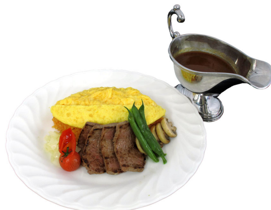
ビーフと箱根西麓野菜のオムライス